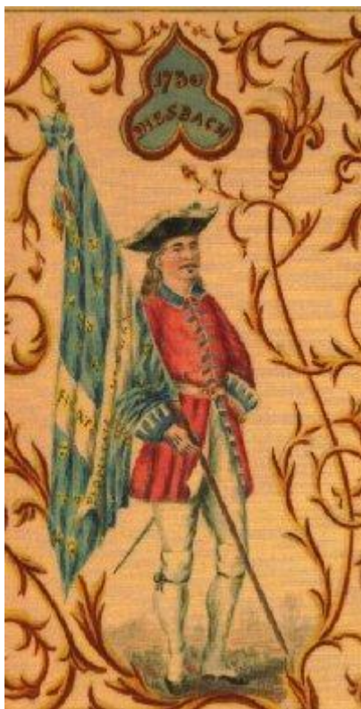
Drapeau colonel du Régiment de Diesbach, 1730.